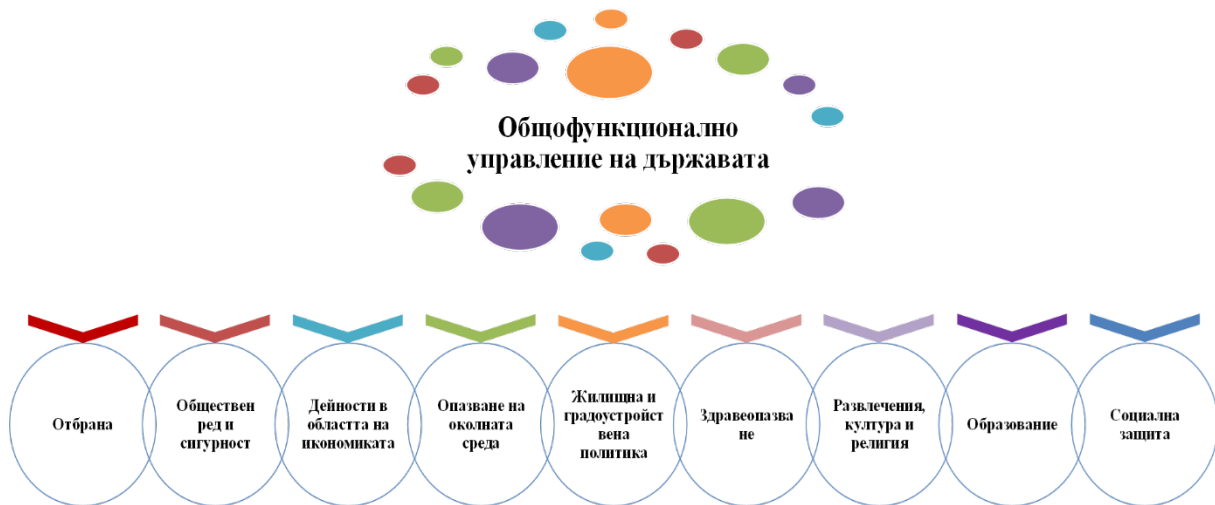
Графика 2. Основни области на политиките, осъществявани от изпълнителната власт