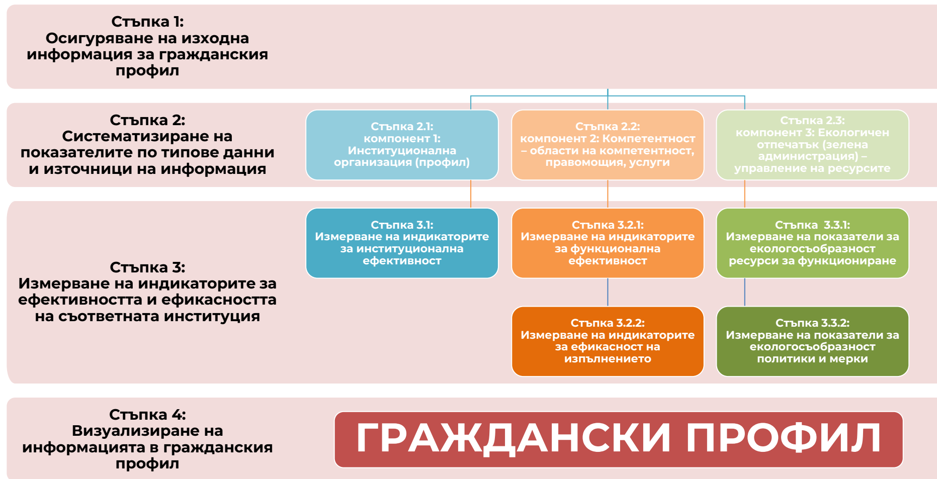
Графика 4. Процедура за изготвяне на "граждански профили"